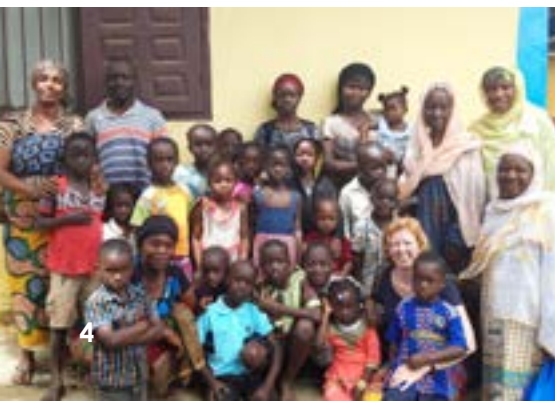
Familie Sekouba en Agaath